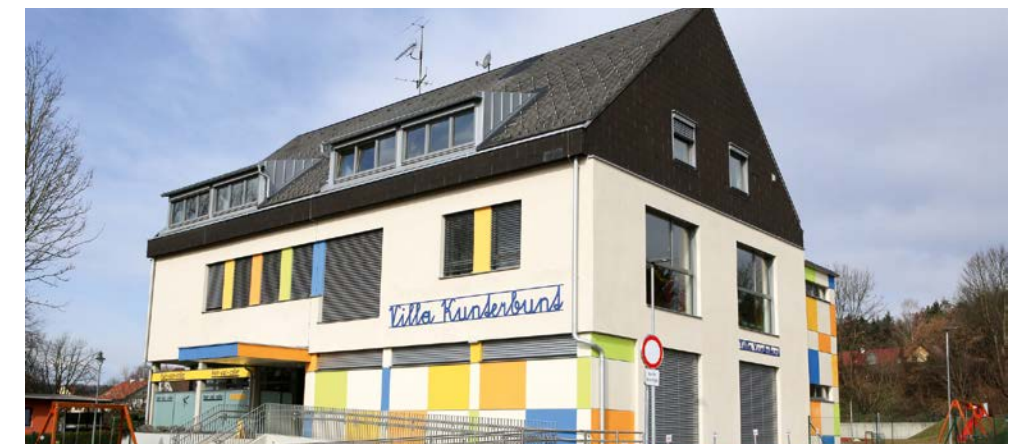
Die Villa Kunterbunt beherbergt jeweils zwei Kindergarten- und Kinderkrippengruppen. Der Name wurde von den Kindern selbst ausgesucht.

„Wir haben vor 5 Jahren versprochen, dass wir bei Kindern und Senioren nicht sparen werden. Ich bin froh, dass es uns trotz des strengen Sparkurses gelungen ist, dieses Versprechen zu halten. Die Herausforderungen werden nicht weniger, aber das Versprechen werden wir auch in den nächsten 5 Jahren halten. Dafür stehe ich.“