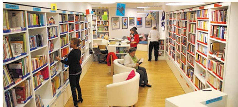
Die ehrenamtlichen Bibliothekarinnen in der Bibliothek im Kinderhaus: 9000 Bücher warten darauf, von Leseratten jeden Alters gelesen zu werden.