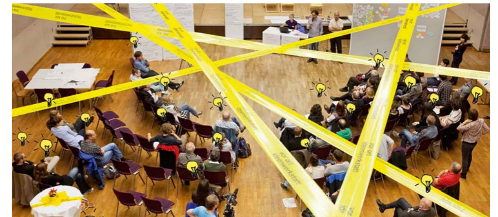
Bürgerbeteiligung steht bei der Ortsentwicklung für uns an oberster Stelle. Mit Ideenwerkstätten und Ortsteilkonferenzen gestalten wir mit Euch die Zukunft.

„Damals wurden die Chancen auf ein attraktives und warmes Ortszentrum verabsäumt. Ein räumliches Leitbild hätte diese Qualität sichern können. Mit den vielen gesammelten Ideen der BürgerInnen kann die Umgestaltung zu einem erlebbaren Ortszentrum gelingen. Deshalb nehme ich diese Herausforderung gemeinsam mit der Bürgerliste an.“