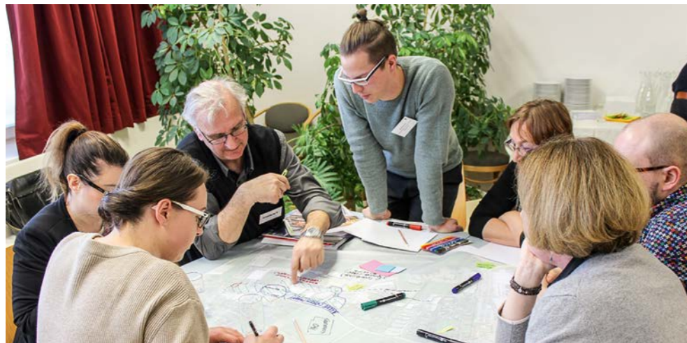
Ideenwerkstatt für ein lebendiges Ortszentrum: Gemeinsam mit der Bevölkerung wurden Visionen zur Neugestaltung des Zentrums entwickelt.