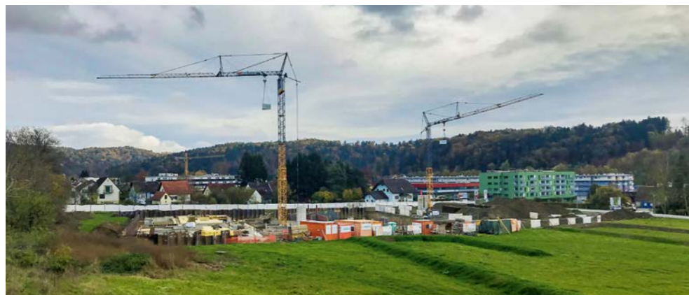
Die beiden Großwohnbauten im Zentrum wurden schon vor 2015 genehmigt. Für die neuen Mehrfamilienhäuser (Eisweg, Pachern Hauptstraße) besteht Rechtsanspruch aufgrund des Flächenwidmungsplans aus 2012.