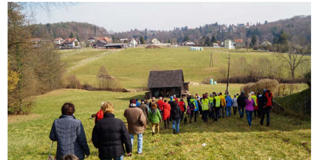
Natur- und Erholungsräume für Mensch und Tier sollen für zukünftige Generationen gesichert werden.

Mit Deiner Unterstützung können wir weiter gemeinsam gestalten.